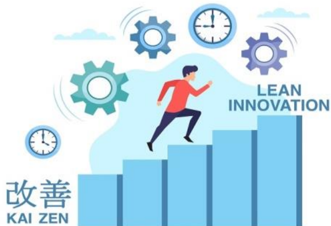
Gambar 1. Prinsip Kaizen dalam Peningkatan Mutu yang Berkelanjutan

Kaizen berarti perubahan dan penyempurnaan yang lebih baik dan berkelanjutan yang melibatkan setiap pihak internal dari segala tingkatan dalam hierarki sebuah organisasi. Kaizen mengutamakan kesadaran akan adanya masalah dan memberikan cara untuk mengidentifikasi masalah. Menurut falsafah Kaizen , penyempurnaan mutu yang berkelanjutan hanya akan terjadi bila ada kepedulian mutu ( quality awareness ) dari manusia. Sehingga W. Edwards Deming mengatakan bahwa mutu adalah tanggung jawab setiap orang ( quality is everyone's responsibility ).